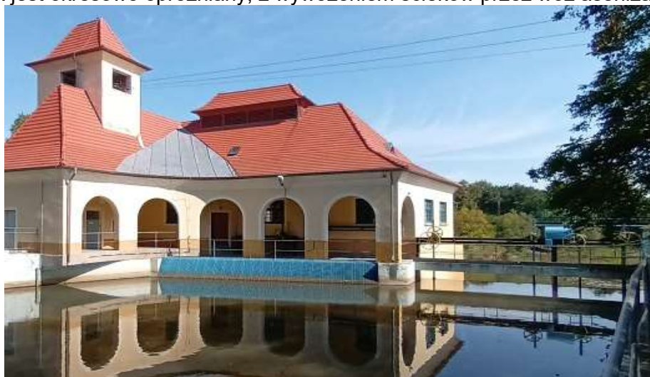
Budynek EW Marszowice

Zbiornik jest okresowo opróżniany, z wywożeniem ścieków przez wóz asenizacyjny.